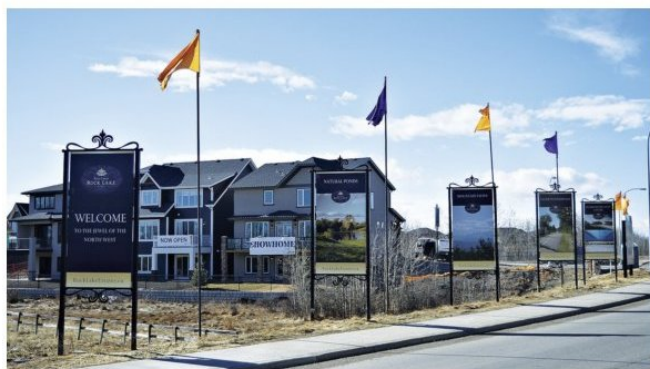
▲ 三套各具特色的展示屋於 3 月 5 日開放。

五湖小區的更多詳情請查詢網站 fivelakes.rocklakeestates.ca 。◇