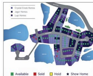
▲ 第四期五湖小區共 103 塊地皮，其中 59 塊可建分門地下室和 14 塊 RC2 地皮。(Rock Lake Estates 網站)

園，而且路徑通達，人們可以盡情享受散步、慢跑等戶外運動。社區周邊臨近學校、食雜店、餐館、農貿市場、高爾夫球場等，駕車僅需 5 分鐘可達沃爾瑪。另外，Rocky Ridge 健身休閒中心正在施工建設，僅步行 10 分鐘的路程。